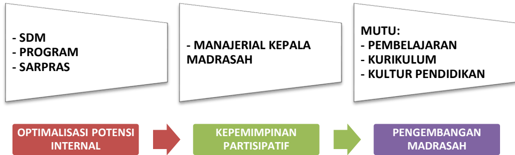
Gambar 3. Model Strategi Manajemen Pengembangan Madrasah Melalui Optimalisasi Potensi Internal (Dokumen Peneliti)

dalam mendorong pengembangan madrasah berbasis potensi internal yang terkelola dengan baik.