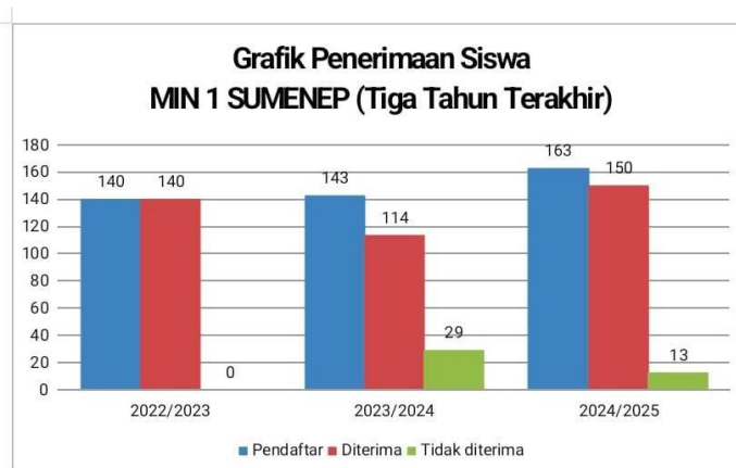
Grafik 1. Jumlah Siswa Pendaftar MIN 1 Sumenep. (Dokumen Madrasah, 2024)

Madrasah Ibtidaiyah Negeri (MIN) 1 Sumenep dianggap sebagai lembaga pendidikan yang mampu memberikan layanan pendidikan yang berkualitas. Hal ini ditunjukkan dengan Peningkatan jumlah siswa pendaftar setiap tahunnya berdasarkan dokumen kesiswaan. Oleh karena itu, penelitian terkait manajemen pengembangan madrasah di MI Negeri 1 Sumenep menjadi sangat relevan untuk memahami faktor-faktor yang menyebabkan kesuksesan tersebut dan bagaimana manajemen madrasah dapat ditingkatkan untuk tetap mempertahankan kualitasnya.