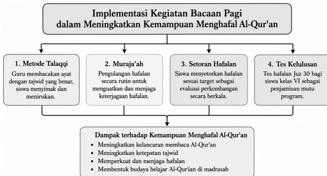
Gambar 2. Implementasi Kegiatan Bacaan Pagi di MI Nasy'atul Muta'allimin Gapura

Hasil penelitian menunjukkan bahwa kegiatan bacaan pagi dilaksanakan secara rutin setiap hari Sabtu sampai Rabu pada jam pertama pembelajaran dengan durasi sekitar 30 menit. Pelaksanaan program melibatkan seluruh peserta didik dan guru pendamping kelas. Kegiatan ini dirancang secara sistematis melalui beberapa tahapan, yaitu talaqqi, muraja'ah, setoran hafalan, dan evaluasi hafalan. Tahapan tersebut saling berkaitan dan membentuk proses pembelajaran yang berkesinambungan dalam mencapai target hafalan yang telah ditetapkan madrasah.